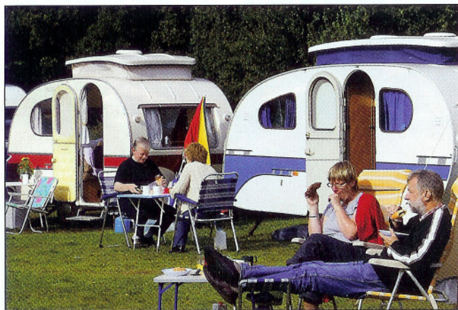
Tja... kamperen blijft kamperen, of je dat nu met een historische caravan doet en bijpassende tuinstoelen of met een hypermodern ingerichte camper XXL+

regio's. Daarvoor is er plek in het programma ingeruimd voor ontmoetingen met - toekomstige - zakenrelaties en worden op diverse plekken onderweg netwerkbijeenkomsten georganiseerd waar u - als vertegenwoordiger van uw bedrijf - andere vertegenwoordigers van overheden en bedrijven ontmoet. En als het gaat over auto's in plaats van zaken, dan praat het vaak ook nog eens een stuk makkelijker. En misschien zijn met dit doel voor ogen de deelnamekosten van € 6.500 als kostenpost in uw boekhouding te noteren? De rally is er een zonder snelheidsselement en daar telt vooral de navigatie en behendigheid. De route voert door zeven landen, start op 2 mei in Leeuwarden en eindigt in Groningen. Meer informatie over de rally, of deelname via de website van Classic Events - www.classicevents.nl - of info@classicevents.nl en 0578-561.115. •