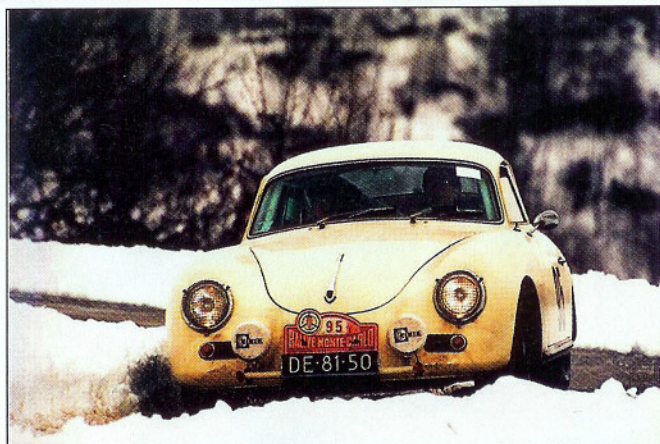
Winterse omstandigheden als tijdens de Monte Carlo Historique zullen de Midwinter Classic wel niet ten deel vallen

Persberichten en ingezonden artikelen voor het decembernummer graag voor 27 oktober insturen